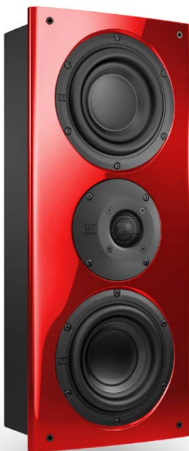
Die Schallwand der nuVero-Lautsprecher ist mit einem perfekt verarbeiteten Hochglanzlack versehen

Für die klangvolle Schallwandlung sind zwei 15 Zentimeter große Tiefmitteltöner und eine 26 Millimeter messende Hochtonkalotte im Einsatz. Durch das flächenbündige Versenken der Chassiskörbe in der Frontplatte und der asymmetrisch angeordneten Hochtonkalotte konnte Nubert das Abstrahlverhalten im Mittelhochtonbereich optimieren. Ebenso durch die stark gerundeten Schallwandkanten. Somit werden Schallschatten durch Kantenreflexionen minimiert, was einen homogenen Frequenzgangverlauf zur Folge hat. Neben der aufwendig gestalteten Frequenzweiche und den exklusiven Membran-Materialien verhilft auch diese Maßnahme der nuVero 50 zu einer besonders linearen und impulsstarken Wiedergabe.