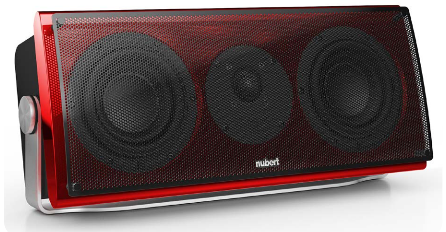
Das stabile Metall-Frontgitter gehört zum Lieferumfang