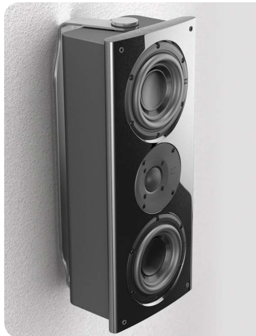
Der massive Edelstahl-Wandhalter gehört zum Lieferumfang und erlaubt das präzise Ausrichten auf den Hörbereich

Damit der Lautsprecher flexibel im Heimkino oder Wohnraum positioniert werden kann, legt Nubert einen erstklassigen Wandhalter bei. Dieser ist aus massivem Edelstahl gefertigt und extrem stabil. Ist die nuVero 50 in den Halter eingeschraubt, kann die Box einfach verdreht werden. Somit kann der Lautsprecher stufenlos geschwenkt werden, was eine genaue Ausrichtung auf den Hörplatz erlaubt. Und das gilt für alle Montageorte. Ob als Höhenlautsprecher an der Decke in einem Dolby Atmos-Heimkino, als Surround-Effektbox an der Rückwand oder als HiFi- und TV-Lautsprecher direkt neben einem Flachbildfernseher an der Wand. Bei allen Montageoptionen sollten auf den Untergrund abgestimmte Dübel verwendet werden, um eine kraftschlüssige Verbindung sicherzustellen. Denn die nuVero 50 bringt trotz kompakter Abmessungen ein stolzes Gewicht von neun Kilogramm auf die Waage. Warum das so ist, lesen Sie im nächsten Abschnitt.